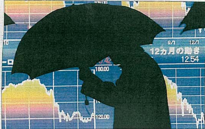
Gut beschirmt durch die Börsenkrise: Einige Dachfonds haben auch 2008 Gewinne geleistet.

FONDSPREIS. Das abgelaufene Börsenjahr bescherte einigen Anlegern auch positive Überraschungen.