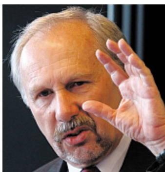
Notenbank-Gouverneur Nowotny: Auskunft zu Swap-Deal.

Linz – Brisanter Auftritt von Nationalbank-Gouverneur Ewald Nowotny: Der frühere Generaldirektor der Bawag wurde vor dem Sonderkontrollausschuss zur Linzer Affäre um vor vier Jahren abgeschlossene Swap-Geschäfte, um die jetzt ein Millionenstreit tobt, befragt.