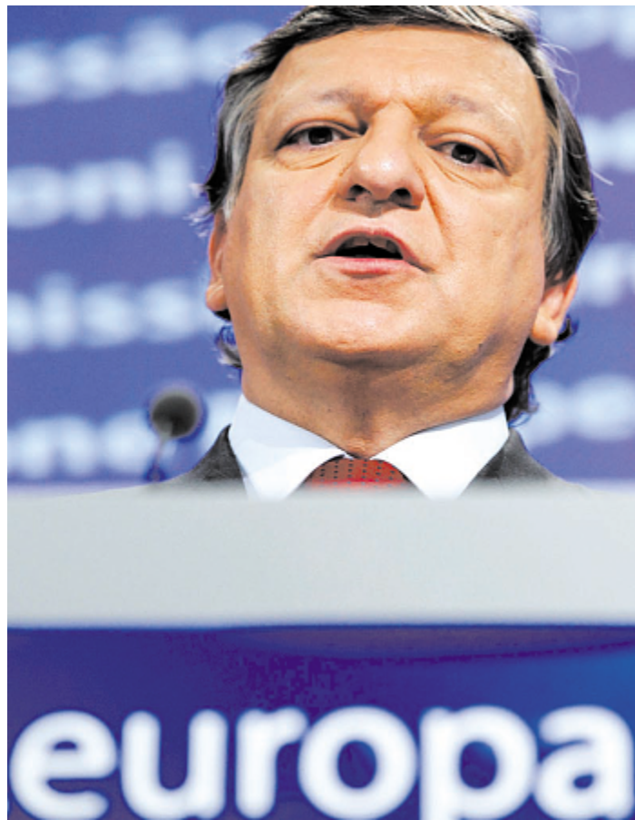
EU-Kommissionspräsident Barroso stößt mit dem Vorschlag von Eurobonds auf heftigen Widerstand der Euro-Geberländer.

Der Streit um Eurobonds reißt die Gräben zwischen den Euroländern noch tiefer auf. Finanzministerin Fekter ist „striktest“ gegen Eurobonds.