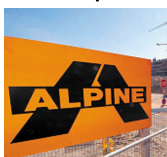
Der Baukonzern könnte zur Gänze an FCC in Madrid gehen.